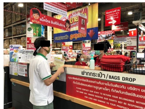
แม็คโคร สาขาลาดพร้าว

รูปที่ 8-1 ประมวลภาพกิจกรรมการสำรวจความคิดเห็นของกลุ่มองค์กรที่ใช้บริการสาธารณูปโภค ในพื้นที่ศึกษาของโครงการ ระหว่างเดือนมกราคม-มิถุนายน 2564 (ตัวอย่าง)