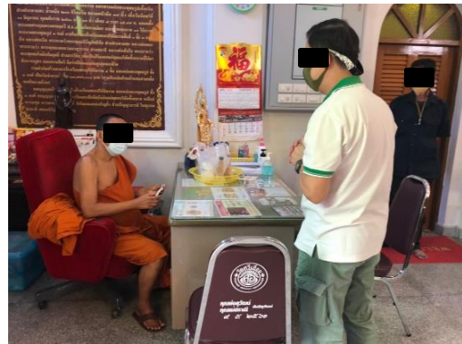
วัดศรีเอี่ยม