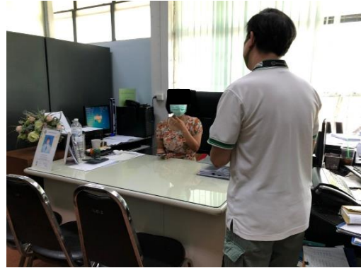
สำนักงานที่ดินพระโขนง