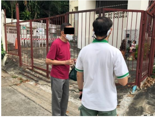
โรงเรียนอนุบาลสุนรี/บ้านสุนรี