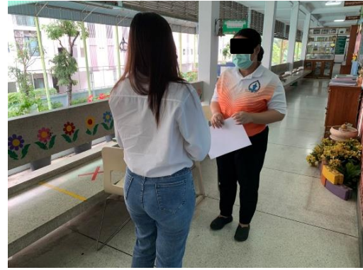
โรงเรียนหัวหมาก/โรงเรียนเทศบาลหัวหมาก