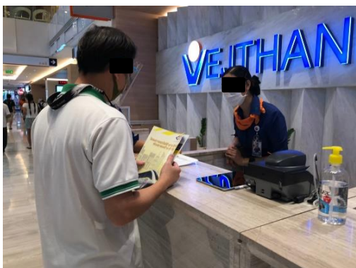
โรงพยาบาลเวชธานี