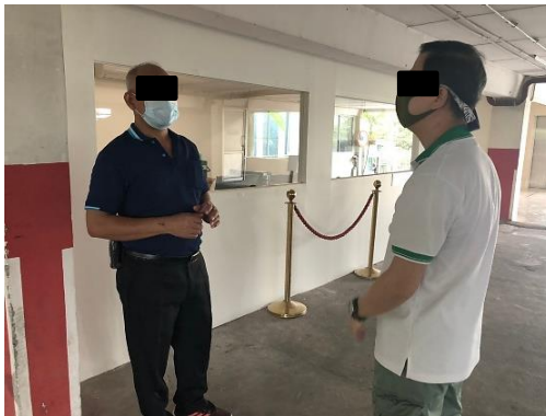
โรงแรมเมเปิล

รูปที่ 8-1 (ต่อ) ประมวลภาพกิจกรรมการสำรวจความคิดเห็นของกลุ่มองค์กรที่ใช้บริการสาธารณูปโภค ในพื้นที่ศึกษาของโครงการ ระหว่างเดือนมกราคม-มิถุนายน 2564 (ตัวอย่าง)