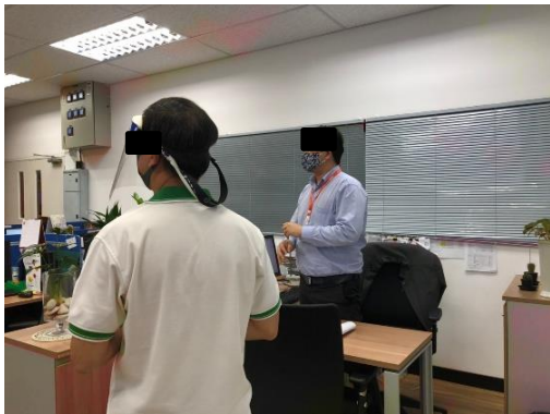
วิทยาลัยดุสิตธานี