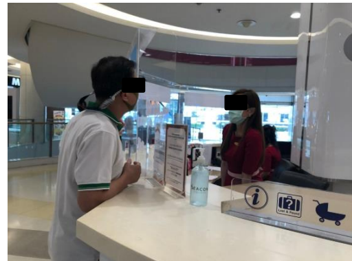
ศูนย์การค้าซีคอนสแควร์

รูปที่ 8-1 (ต่อ) ประมวลภาพกิจกรรมการสำรวจความคิดเห็นของกลุ่มองค์กรที่ใช้บริการสาธารณูปโภค ในพื้นที่ศึกษาของโครงการ ระหว่างเดือนมกราคม-มิถุนายน 2564 (ตัวอย่าง)