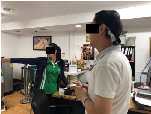
โรงพยาบาลลาดพร้าว