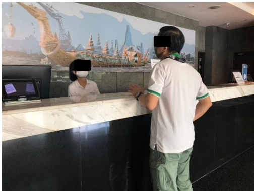
โรงแรมโนโวเทล กรุงเทพ บางนา