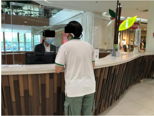
พาราไดซ์พาร์ค