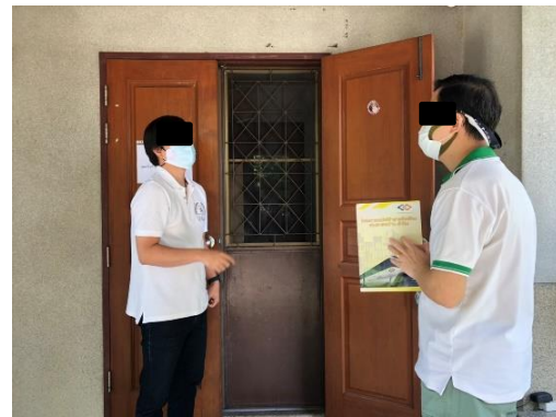
วัดแม่พระกุหลาบทิพย์