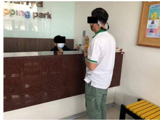
ธัญญาพาร์ค