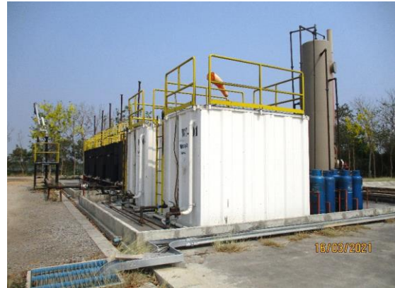
รูปที่ 1-2 ฐานหลุมผลิต L53-B ในระยะผลิตปิโตรเลียม