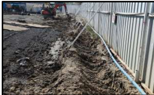
รูปภาพระบายน้ำสำหรับป้องกันมิให้น้ำหลากจากด้านนอกไหลเข้าสู่พื้นที่ก่อสร้าง

ในช่วงหน้าฝนของการก่อสร้างจะมีระบายน้ำชั่วคราวโดยรอบบริเวณพื้นที่ก่อสร้างเพื่อป้องกันน้ำหลากจากบริเวณข้างเคียงไม่ให้ไหลเข้าบริเวณก่อสร้าง และป้องกันน้ำหลากจากบริเวณก่อสร้างที่ชะล้างหน้าดินไหลเข้าสู่พื้นที่ข้างเคียง น้ำหลากที่ไหลลงระบายน้ำจะเข้าสู่บ่อพักตะกอน เพื่อให้สารแขวนลอยตกตะกอนก่อนระบายออกสู่ท่อระบายน้ำฝนของนิคมฯ หน้าโครงการต่อไป