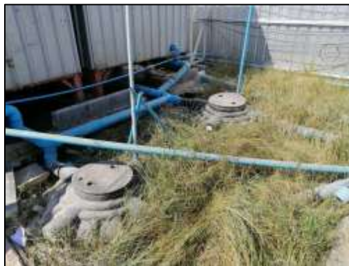
รูปถ่ายถังบำบัดน้ำเสียสำเร็จรูปแบบเติมอากาศ