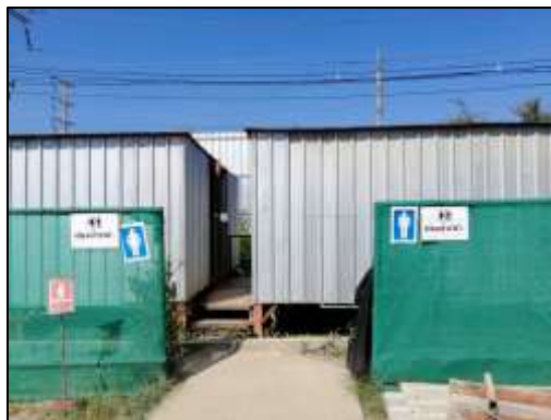
รูปถ่ายห้องน้ำห้องส้วม

ผู้รับเหมาก่อสร้างจะจัดสร้างห้องส้วมชาย-หญิง จำนวน 34 ห้อง สำหรับคนงานก่อสร้าง โดยคาดว่าจะมีปริมาณน้ำเสียจากห้องส้วมประมาณ 13.5 ลบ.ม./วัน (กำหนดให้ปริมาณน้ำเสียเท่ากับปริมาณน้ำใช้) และน้ำเสียจากการล้างทำความสะอาดประมาณ 5 ลบ.ม./วัน จะรวบรวมเข้าสู่ถังบำบัดน้ำเสียชนิดเติมอากาศ ขนาดความสามารถ 20 ลบ.ม./วัน น้ำทิ้งจากถังบำบัดฯ ที่มีค่า BOD ไม่เกิน 30 มก./ล. (มาตรฐานตามประกาศกระทรวงทรัพยากรธรรมชาติและสิ่งแวดล้อม เรื่อง กำหนดมาตรฐานควบคุมการระบายน้ำทิ้งจากอาคารบางประเภทและบางขนาด พ.ศ. 2548 (อาคารประเภท ข)) จะระบายออกสู่ท่อรวบรวมน้ำเสียของนิคมอุตสาหกรรมอมตะซิตี้ ชลบุรี ซึ่งจะรวบรวมไปเข้าสู่ระบบบำบัดน้ำเสียของนิคมฯ ต่อไป