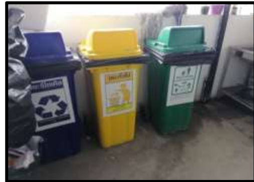
รูปภาพถังรองรับมูลฝอย และจุดคัดแยกขยะ