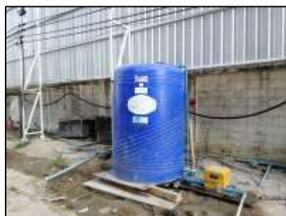
รูปภาพถังสำรองน้ำใช้

(1.2) น้ำใช้สำหรับกิจกรรมการก่อสร้าง ได้แก่ การใช้น้ำเพื่อการบ่มคอนกรีต การทำความสะอาดเครื่องมือและอุปกรณ์ต่างๆ การล้างล้อรถ การพรมน้ำดินเพื่อป้องกันฝุ่น รวมทั้งการทำความสะอาดพื้นที่และอื่นๆ การใช้น้ำเพื่อการก่อสร้างคาดว่าจะมีปริมาณ 5 ลบ.ม./วัน