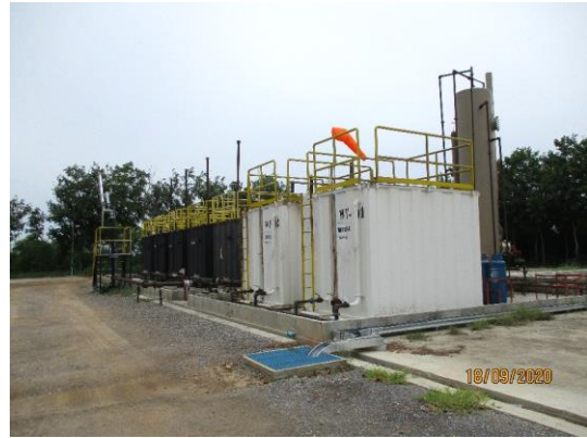
รูปที่ 1-2 ฐานหลุมผลิต L53-B ในระยะผลิตปิโตรเลียม