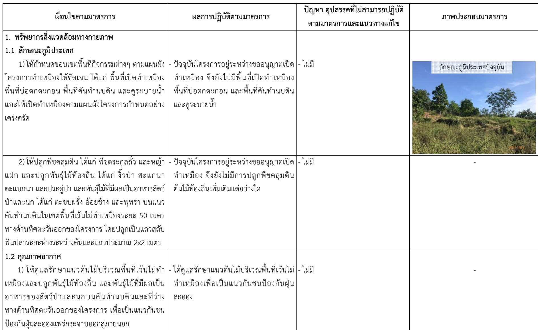
ตารางที่ 2.2-1 ผลการดำเนินการตามมาตรการป้องกันและแก้ไขผลกระทบสิ่งแวดล้อม ในระยะเตรียมการทำเหมือง