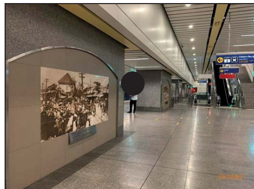
บริเวณสถานีรถไฟฟ้า