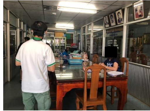
โรงเรียนคลองกระทุ่มราษฎร์อุทิศ