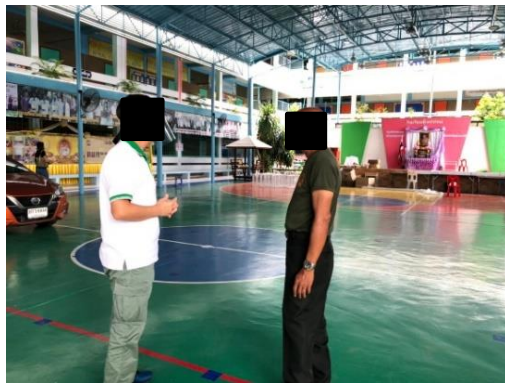
โรงเรียนสุเหร่าใหม่