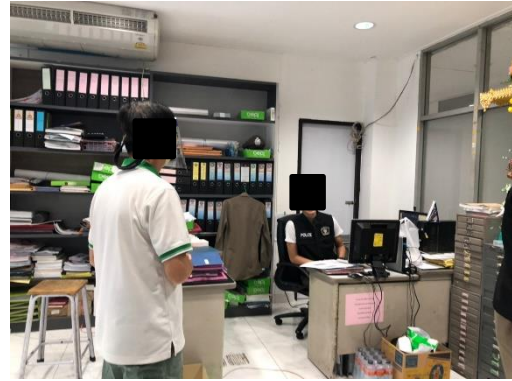
แฟลตตำรวจ สน.โชคชัย 4