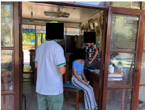
โรงเรียนสิริวิฑูวิทยา