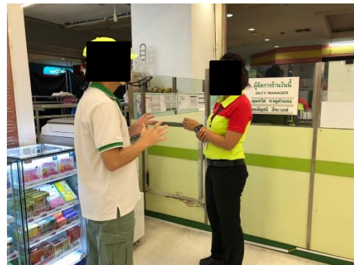
บีกชีลาดพร้าว