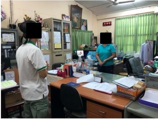
โรงเรียนพิบูลอุปถัมภ์