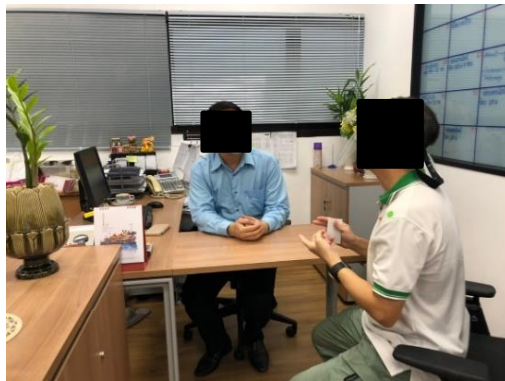
วิทยาลัยดุสิตธานี