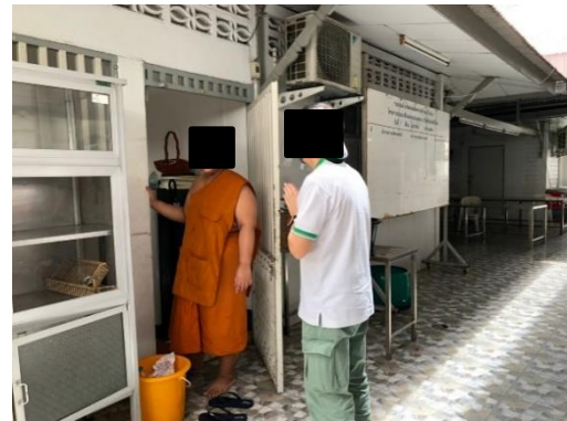
วัดศรีเอี่ยม

รูปที่ 8-1 (ต่อ) ประมวลภาพกิจกรรมการสำรวจความคิดเห็นของกลุ่มองค์กรที่ใช้บริการสาธารณูปโภค ในพื้นที่ศึกษาของโครงการ ระหว่างเดือนมกราคม-มิถุนายน 2563 (ตัวอย่าง)