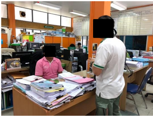
สำนักงานเขตบางกะปิ