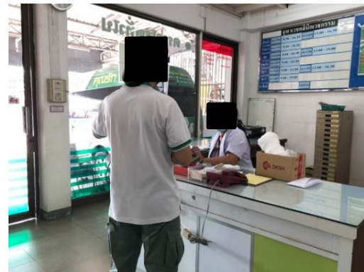
โรงพยาบาลจุฬาเวช