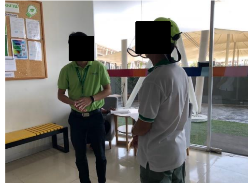
ธัญญาพาร์ค ศรีนครินทร์