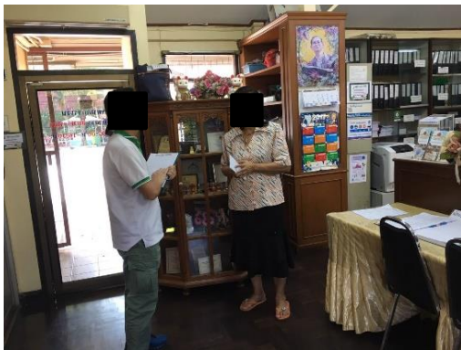
โรงเรียนถนนอมพิศวิทยา