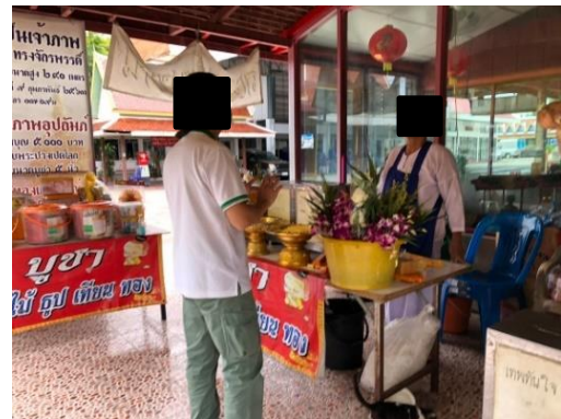
วัดจจรศิริ