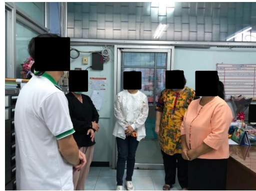
โรงเรียนคลองกлянตัน