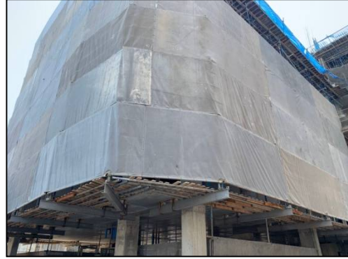
ภาพที่ 1.6-1 สถานภาพการก่อสร้างโครงการในปัจจุบัน