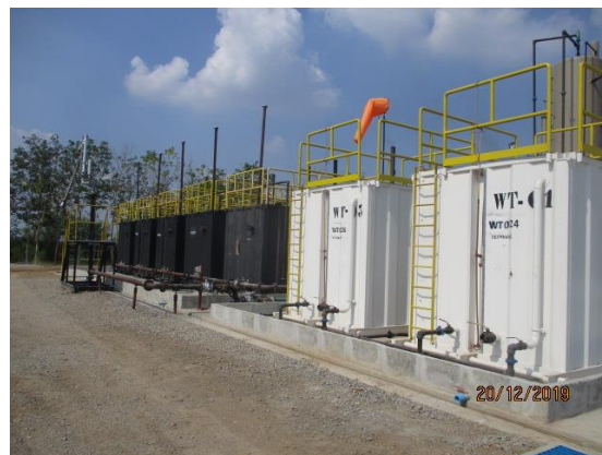
รูปที่ 1-3 ฐานหลุมผลิต L53-B ในระยะทดสอบหลุมและผลิตปิโตรเลียม