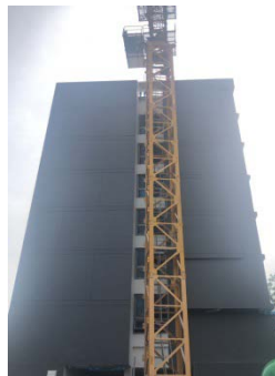
เดือนมกราคม 2562

สถานภาพทั่วไปของโครงการอยู่ระหว่างการก่อสร้างงานโครงสร้าง แสดงดังภาพการก่อสร้างโครงการ ปัจจุบัน รูปที่ 1-1