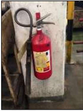
ภาพที่ 23 ถังดับเพลิงแบบมือถือ