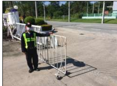
ภาพที่ 10 เจ้าหน้าที่รักษาความปลอดภัย ทางเข้า - ออกพื้นที่โครงการ