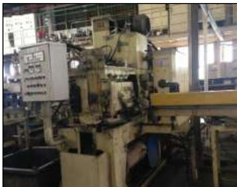
ภาพที่ 21 อุปกรณ์ไฟฟ้าที่มีสายดินทุกระบบ