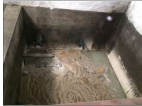
ภาพที่ 8 ถังตกไขมัน