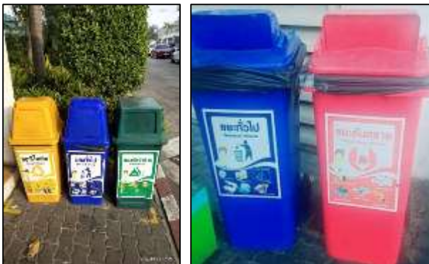
ภาพที่ 13 ถังรองรับขยะมูลฝอย