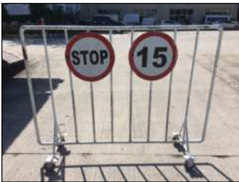
ภาพที่ 11 ป้ายจำกัดความเร็วภายในพื้นที่โครงการ