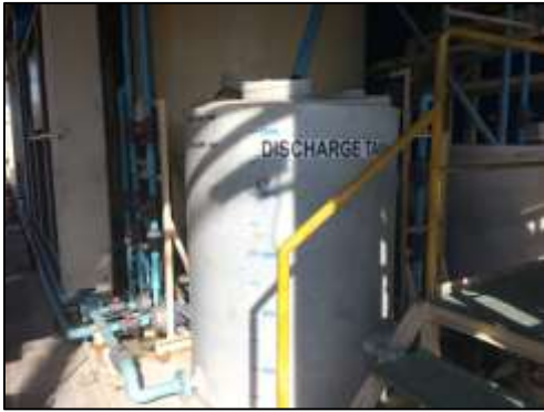
ภาพที่ 7 ระบบบำบัดน้ำเสียสำเร็จรูป ชนิดเกราะ-กรองไร้อากาศ