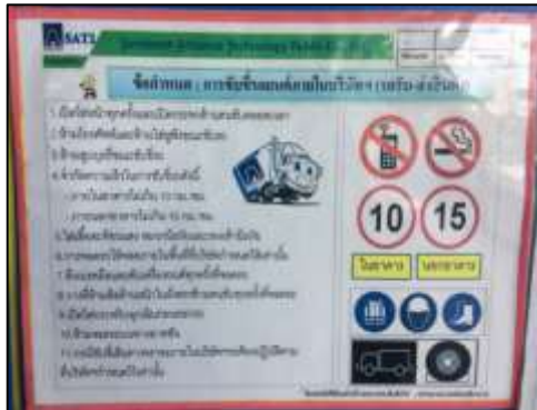
ภาพที่ 9 ข้อกำหนดการขับซีรียนต์ ภายในบริษัทฯ