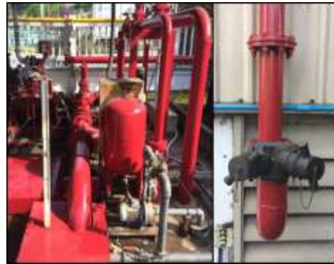
ภาพที่ 16 เครื่องสูบน้ำดับเพลิง และหัวรับน้ำดับเพลิง