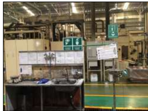
ภาพที่ 14 ฝักบัวและที่ล้างตาฉุกเฉิน