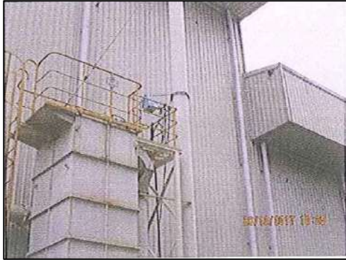
ภาพที่ 1 ระบบดักฝุ่น