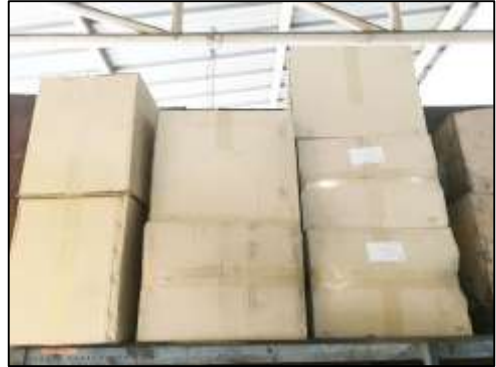
ภาพที่ 2 การสำรองถุงกรองของระบบดักฝุ่น