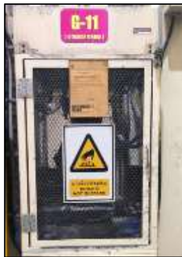
ภาพที่ 19 ป้ายเตือนอันตรายเกี่ยวกับความร้อน