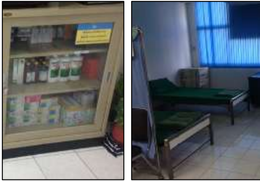
ภาพที่ 15 อุปกรณ์พยาบาล/ห้องพยาบาล