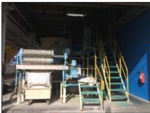
ภาพที่ 5 ระบบบำบัดน้ำเสีย