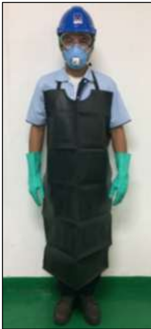
ภาพที่ 3 สวมใส่อุปกรณ์ป้องกัน