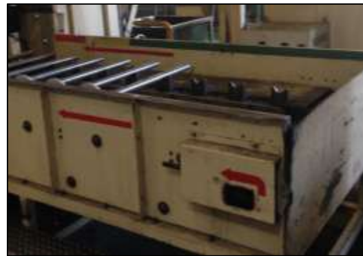
ภาพที่ 20 พื้นที่ที่ติดตั้งเครื่องจักรที่มีความร้อน