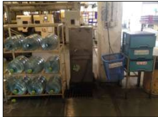
ภาพที่ 18 สุวีستیการน้ำดื่ม