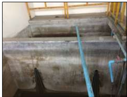
ภาพที่ 6 บ่อพักน้ำทิ้ง