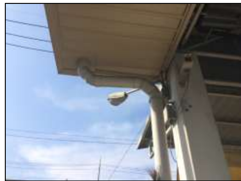
ภาพที่ 12 รางระบายน้ำฝน