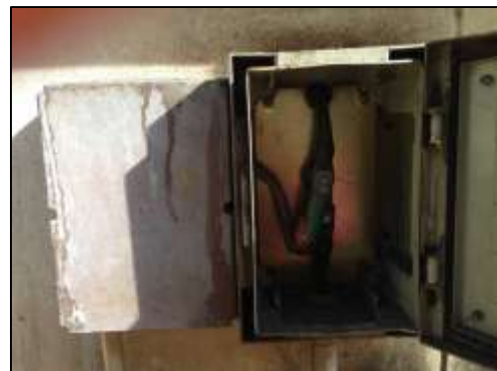
ภาพที่ 22 สายล่อฟ้าภายในพื้นที่โครงการ