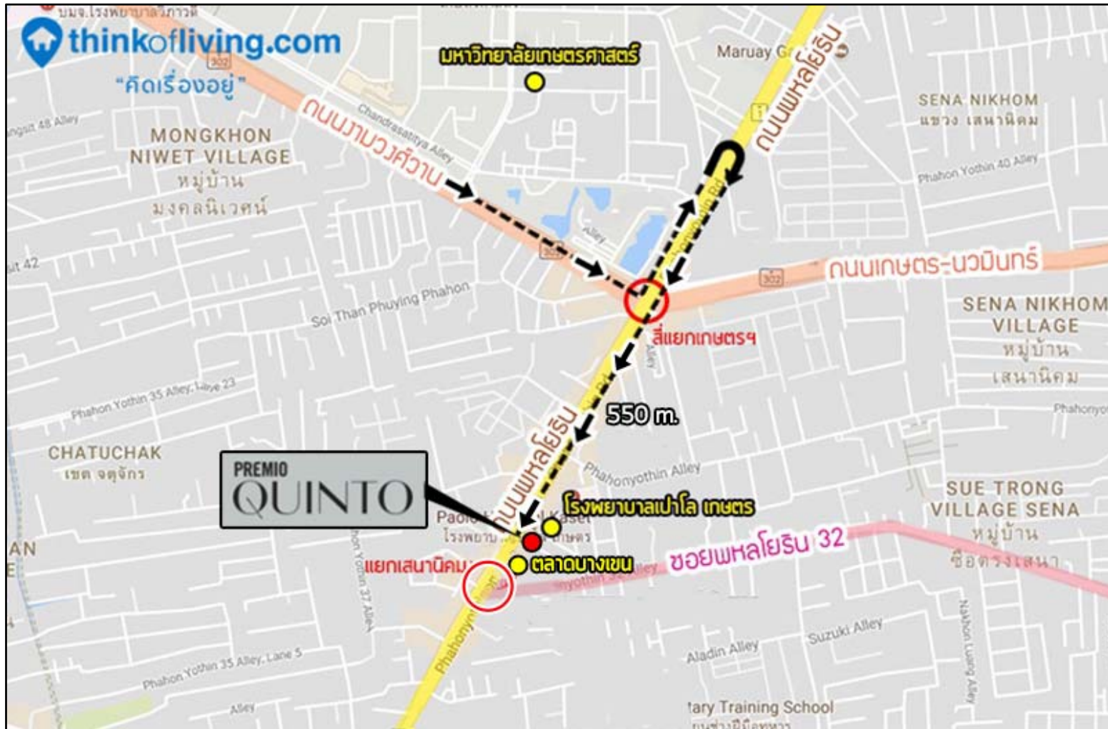
รูปที่ 1-2 การคมนาคมเข้าสู่พื้นที่โครงการ